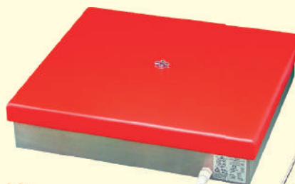
Szalka WGJ-P (32kg rozd. 1g)