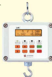
Waga ręczna WGJ-R (32kg, rozd. 1g)