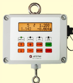
Waga ręczna WGJ-R